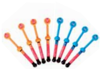
Gradia Direct Anterior / Posterior / X