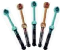
G-aenial Anterior / Posterior